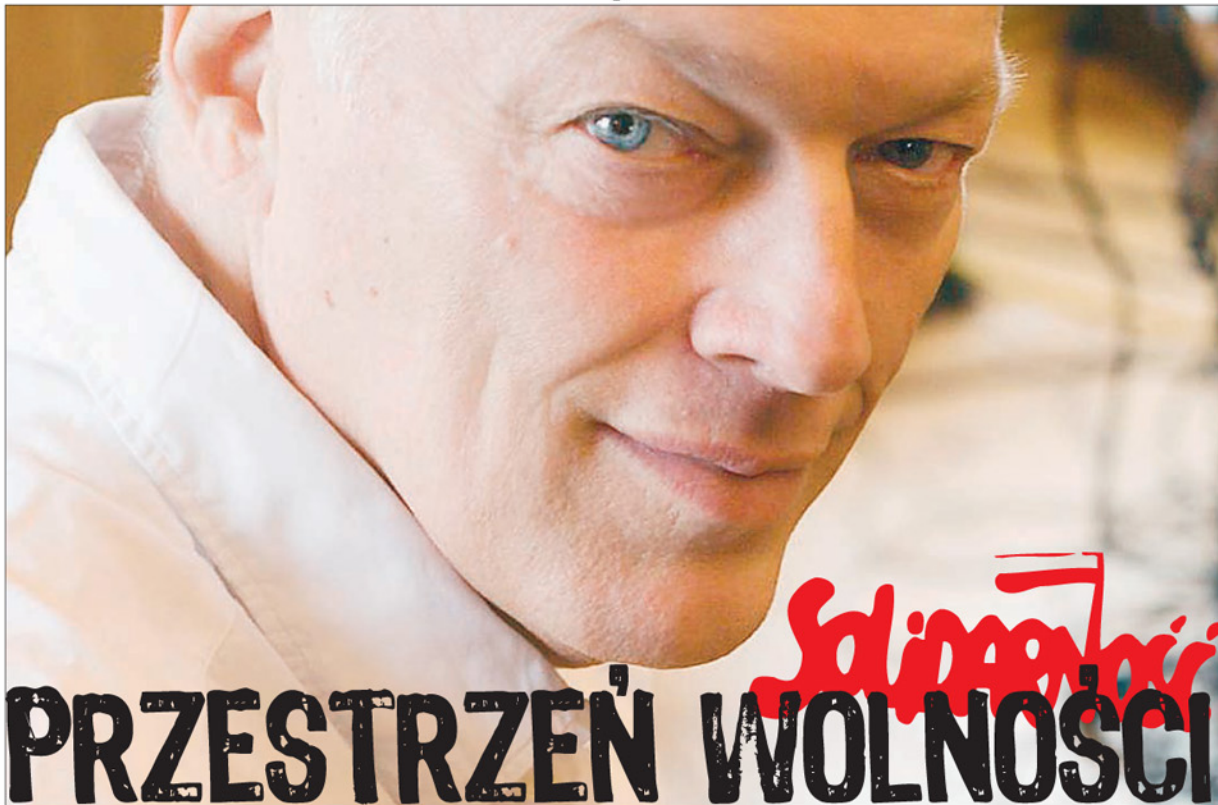
David Gilmour zagra dziś dla kilkudziesięciu tysięcy fanów.